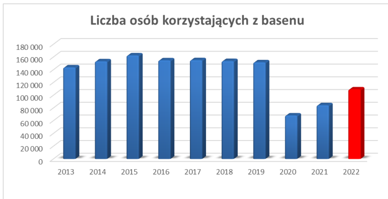
Wykres 2 Liczba osób korzystających z basenu w latach 2013 – 2022